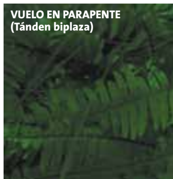
VUELO EN PARAPENTE (Tándem biplaza)