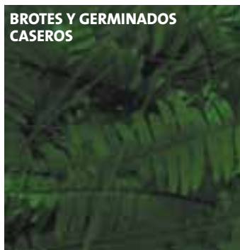
BROTOS Y GERMINADOS CASEROS